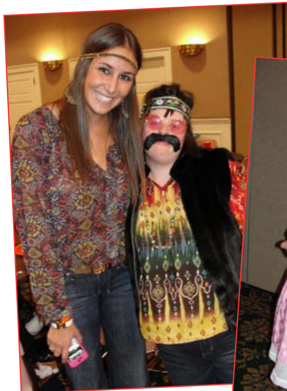
DSG y SMU son los mejores Amigos de Halloween.