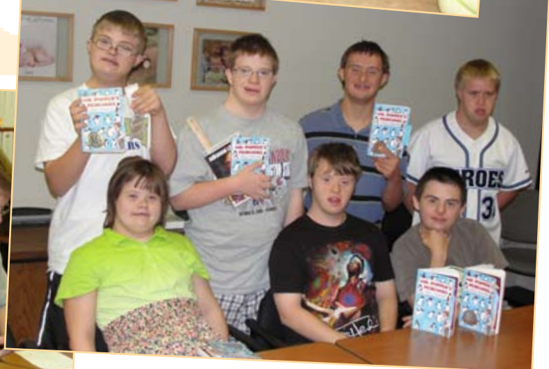
El club del libro de los adolescentes del DSG leyeron Mr. Popper's Penguins este verano.