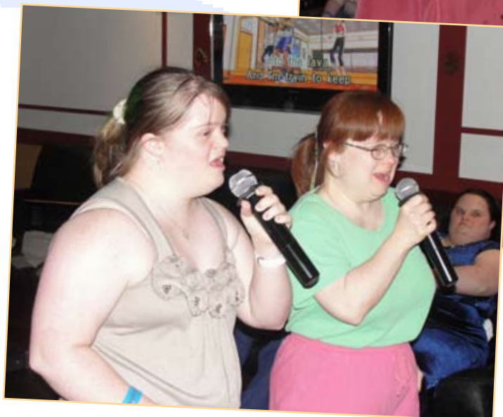
Los miembros del grupo opción para adultos cantaron con todos sus corazones en el Dallas Family Karaoke.