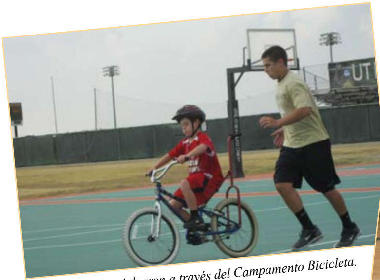
Los campistas pedalearon a través del Campamento Bicicleta.