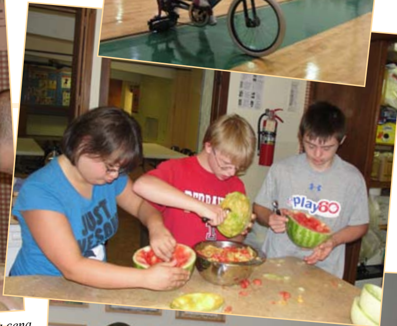
Los adolescentes del DSG cocinaron una cena muy saludable y se divertieron mucho.